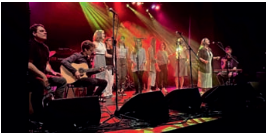
Na dobrodelnem koncertu v Žireh so zbrali 3250 evrov za žirovske gasilce in prizadete v poplavah.

AddBeatke so s svojimi vokali in sproščeno interpretacijo ob spremljavi Klemna, Marka in Danija z mladostnim žarom zagrele publiko. Nadaljevala sta Martin in Uršula Ramoveš z nekoliko prilagojenim programom zaradi tehničnih motenj, ki sta jih profesionalno zaobšla in kljub temu publiko približala Janezovo poezijo, podorno in blizu našemu čustvovanju in temperamentu. V nadaljevanju je sledil Trio Jana Isteniča, ki nas je z odličnim klasičnim džezom preselil v ameriške lokale prejšnjega stoletja. Tako se je pestra glasbena ponudba nadaljevala do benda Uninvited, ki je zaplul že v težje vode roka s prepričljivo pevko in izvirnimi kritičnimi