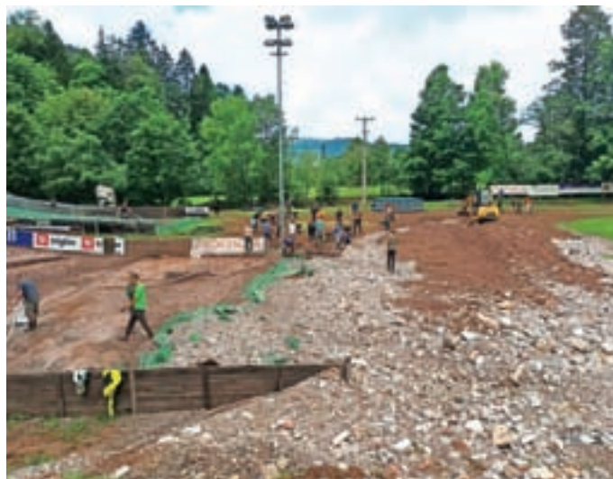
Nordijski center Poclairn je v poplavih utrpel veliko škodo, ki jo bomo sanirali še kar nekaj časa.

Žal pa v avgustu nismo bili izvzeti iz naravnih nesreč. Nordijski Center Poclairn je utrpel veliko škodo, ki jo bomo sanirali še kar nekaj časa. Voda je poplavlila garderobe, tehnično sobo in skladišče z opremo, najhuje pa je bilo v izteku skakalnic in na delu parkirišča. Na parkirišču je odneslo dobršen del brežine in asfalta ter spodkopalo drog z reflektorji, s skakalnic pa je odneslo precej plastike in poškodovalo ograjo. V najnižji del izteka je nanoslo veliko naplavin v obliki peska, skal in zemlje. Zopet smo dokazali, da v Žireh s skoki mislimo resno. Tako je bilo pri sanaciji v zgolj dveh tednih narejenih več kot 900 delovnih ur, ki so jih izvedli prostovoljci iz vrst staršev, navijačev, trenerjev, športnikov in vodstvenih delavcev kluba. Na delovne akcije so se odzvali tudi