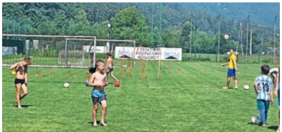
Nogometni klub Žiri je tudi letos konec avgusta pripravil poletno otroško nogometno šolo.

Otroci so se v prijetnem vzdušju pod vodstvom profesorjev in študentov športne vzgoje ter trenerjev mlajših kategorij Nogometnega kluba Žiri seznanili z nogometnimi veščinami, vsak dan pa so poskrbeli tudi za spremljevalne dejavnosti, v okviru katerih so imeli priložnost za sproščeno zabavo. Po besedah pomočnika vodje nogometne šole Naceta Mla-